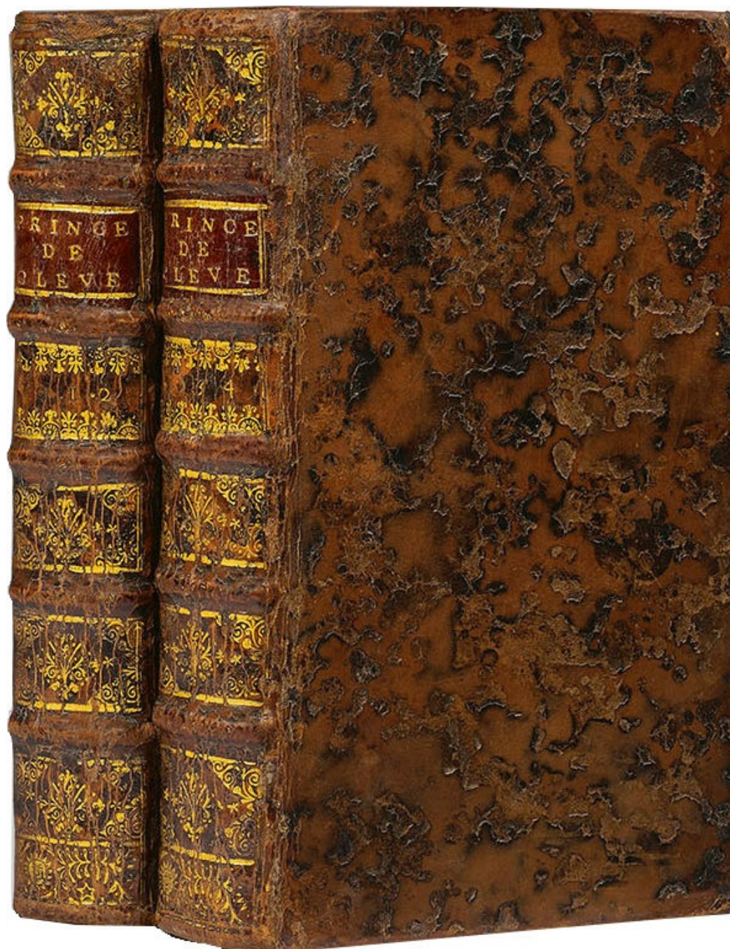
La Princesse de Clèves , deuxième édition, 1678

par le fait que ce découpage est dû à l'éditeur, fût-il le premier - rappelons que les quatre tomes sont répartis en deux volumes -- la lettre n'en reste pas moins située au milieu géométrique de l'oeuvre 15 dans notre expérience de lecture.