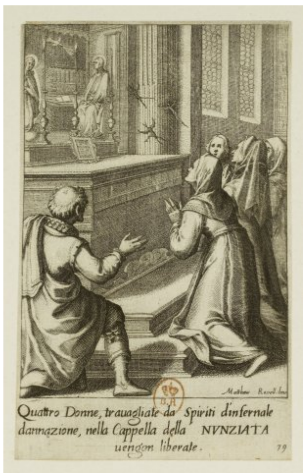
Les quatre Dames (Miracles de Notre-Dame de l'Annonciation de Florence) - Jacques Callot

florentine de l'Annunziata, devant la fresque qui se trouve derrière l'autel.