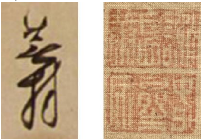
Fig. 4. Signature [Buson] et sceaux [Shachōkō ; Shunseishi]

L'explication contextuelle en prose est la suivante : « À Kyoto, les fleurs de cerisier tombent comme le gofun [poudre fine de coquilles d'huître] dans la peinture de Mitsunobu ». Tosa Mitsunobu est un peintre de cour du XVe siècle, figure majeure de l'école officielle liée à l'aristocratie impériale.